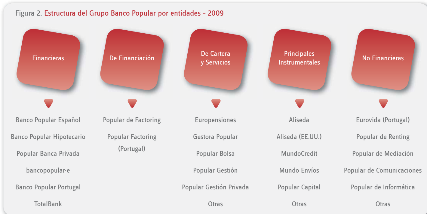
Figura 2. Estructura del Grupo Banco Popular por entidades - 2009

“ La fusión de los bancos filiales fortalecerá la competitividad del Grupo en el mercado financiero español